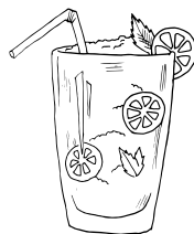
RHUM-COLA RHUM BRUN COCA CITRON 8,5€